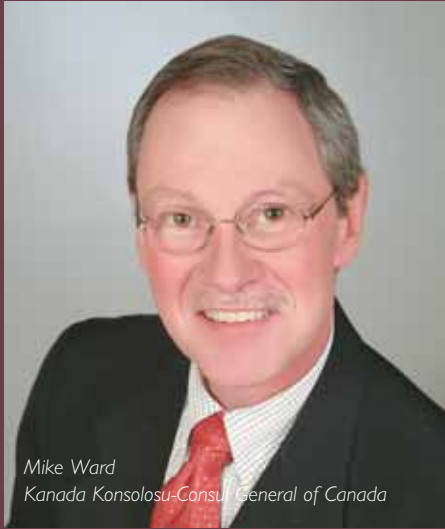
Mike Ward Kanada Konsolosu-Consul General of Canada

Türkiye Kanada ilişkileri özellikle Kanada tarafından yapılan ziyaretler ve yapılan anlaşmalar neticesinde olumlu bir ivme kazandı. 2009 yılında gerçekleştirilen ve Kanada - Türkiye arasında bugüne kadar yapılan en büyük ticaret heyetine önderlik etmiş olmaları da bunun açık kanıtı. Kanada Konsolosu Mike Ward, Kanadalı firmaların Türkiye pazarında iş beklentilerini geliştirmeleri için Çifte Vergilendirmenin Önlenmesi Sözleşme'sinin yapılması, çift taraflı bir Hava Yolu Taşımacılığı Anlaşması'nın müzakere edilmesi ve İstanbul'da bir Kanada Konsolosluğu'nun kurulması olarak açıklıyor. Ward, kısa sürede de iki ülke hükümetlerinin, bu hususların tümünde önemli adımlar attıklarını da dile getiriyor.