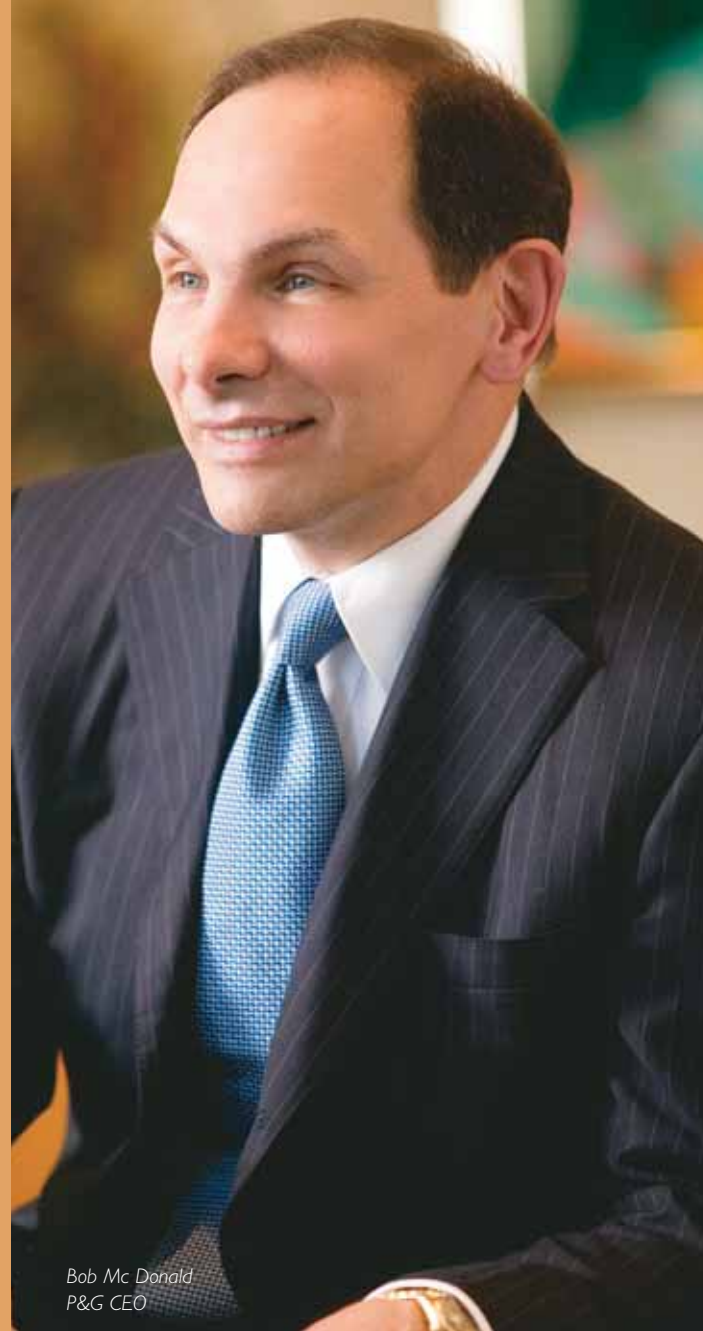
Bob McDonald P&G CEO

“We are greatly impressed by the importance Turkey attaches to the development of infrastructure, to innovation and education investments”