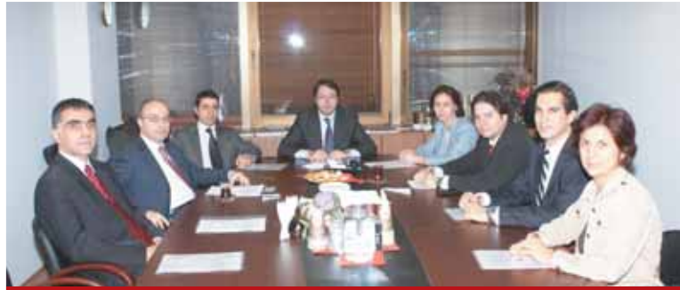
Ekonomik Araştırmalar ve Politikalar Çalışma Grubu Economic Research and Policies Working Group

beklenmeli. Görünen o ki, asıl zor olan konu çıkış stratejilerinin zamanlamasında ince ayar yapmak olacak.