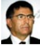
Konuk Konuşmacı: Vedat Mirmahmutoğulları Tarım ve Köyişleri Bakanlığı, Müsteşar