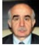
Nazım Ekren Devlet Bakanı ve Başbakan Yardımcısı