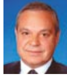
Selahattin Hakman Sabancı Holding Enerji Grubu Başkanı