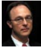
Konuk Konuşmacı: Ulrich Zachau Dünya Bankası, Türkiye Temsilcisi

Eşikaltı tut-sat piyasalarında yaşanan dalgalanmalarla tetiklenen ekonomik kriz, tüm dünya için ekonomik ve finansal altyapılarda değişimi zorunlu kılıyor. Değişen dünya düzeninde, bu yeni ortamın Uluslararası Doğrudan Yatırımlar için hangi risk ve fırsatları beraberinde getirdiği söz konusu oturumda tartışılması amaçlanmaktadır.