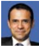
Alpaslan Korkmaz Türkiye Yatırım Destek ve Tanıtım Ajansı Başkanı