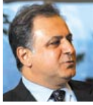
Oturum Başkanı: Haluk Sur ULI Türkiye Başkanı