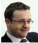
Scott Dickson Berwin Leighton Paisner LLP, Enerji Projeleri Hukuk Müş.

Enerji ihtiyacının hızla artmasının yanı sıra, enerji kaynaklarına erişim maliyetleri de her geçen gün artmaktadır. Bu durum üretim, altyapı ve kaynaklarının çeşitlendirilmesi gereğini doğurmaktadır. Kamu kaynaklarının yanı sıra özel sektör imkanlarının da en efektif şekilde kullanarak enerji yatırımlarının artırılmasının önemi açıktır. Bu açıdan dünyadan örneklerle Türkiye’de yapılan ve yapılması gerekenler söz konusu oturumda tartışılacaktır.