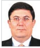
İbrahim Çanakcı Hazine Müsteşarı