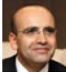
Mehmet Şimşek Devlet Bakanı