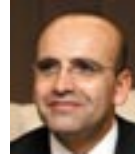
Konuk Konuşmacı: Mehmet Şimşek Devlet Bakanı