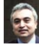
Konuk Konuşmacı Fatih Birol Uluslararası Enerji Ajansı, Baş Ekonomist